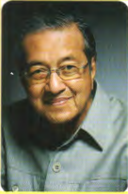
TUN DR MAHATHIR MOHAMADA